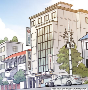
*ESCUELA DE BALLET MUNGYOUNG